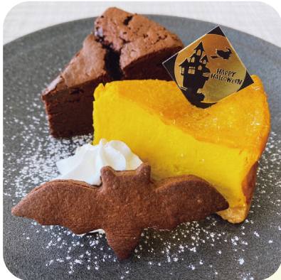
季節限定・ハロウィンデザート

〒033-0041 青森県三沢市大町二丁目6番27号 ● TEL0176-53-3550 ● FAX0176-53-2480 ● wmaster@rakuseikai.or.jp ●