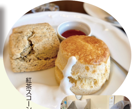
紅茶スコーン & ブレインスコーン