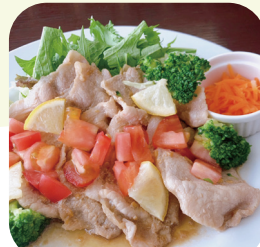
季節限定・ポークジンジャー