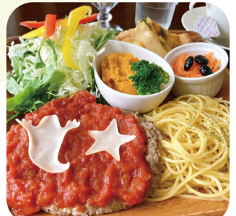
季節限定・ハロウィンランチ