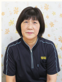
ソーシャルワークセンター ウイメンズライツみさわ

七月一日より、ソーシャルワークセンターが桜町に移転しました。設備が整ったこともあり、二ヶ月に一回開催している三沢こども宅食おすそわけ便の他に、その都度寄付のあった食品などを子育て家庭のみなさんに提供できるようにになりました。移転して最初の提供はスターゼンミートプロセッサ株式会社様からいただいた冷凍レバーと豚肉の配布でした。こども宅食のLINEを活用して申込を募り、八月八日、九日の二日間にかけて二〇世帯の方に配布しました。お肉ということもあり大変好評で喜ばれていました。不定期での開催になりますが、こうした活動もこれから増えていくと思います。少しでも子育て家庭のみなさんの役に立てるよう、試行錯誤してイベントなどを計画していきたいと思っています。