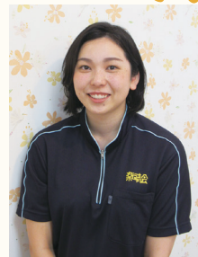
ソーシャルワークセンター 親子安心ネットワーク・みさわ ソーシャルワーカー