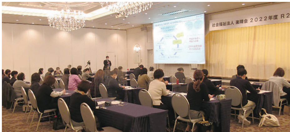
2022年度 R2研修 きざん三沢会場での模様

本年は四月の初任者研修に始まり十二月九日の拠点長研修までが終了しております。今回はその模様を写真を交えてお伝えいたします。