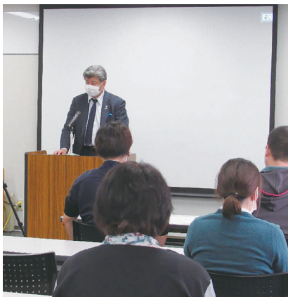
指導者としての在り方について

先にR3・R4（当会の管理者クラス）、後日にR1-3・R2（指導者レベル）向け「指導者としての在り方」と題しハラスメントの事例などを用いて理事長より講義をいただきました。指導者としてどのような心持、言動であるべきか皆真剣に受講しておりました。