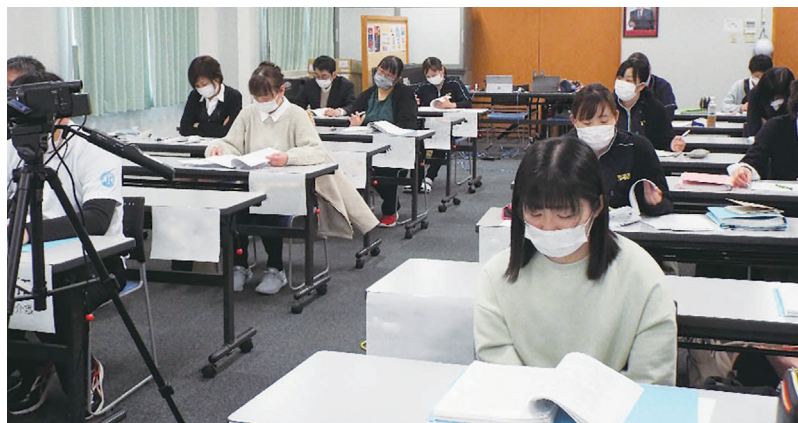
2022年度 前期初任者研修 栄町研修室での模様

初任者研修は前期・後期で入職の時期に分けて開講いたしました。四日間に渡り、社是・経営理念、労務管理・服務規程、ハラスメント、ISO、事故・紛争、マナー等に行き渡り、サービスの基本である「介護」、「看護」、「障害」、「食」等について、当会の職員が講師を務めました。受講職員からは「このような講義を行える先輩職員がいることに感激した」などの声が聞かれました。